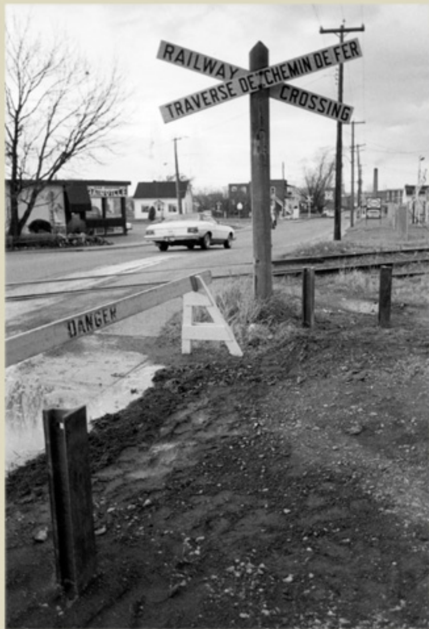
Fonds Les Voies de l'Est, photo de Mario Béland, 1987, Société d'histoire de la Haute-Yamaska.