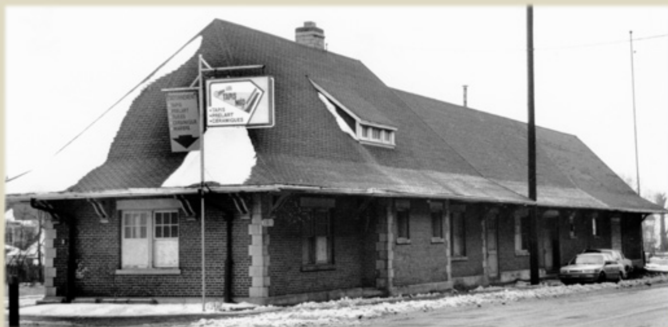
Fonds La Voie de l'Est, photo Alain Dion, 1990, Société d'histoire de la Haute-Yamaska.

Les installations du Canadien National, rue Denison, peu de temps avant leur démolition.