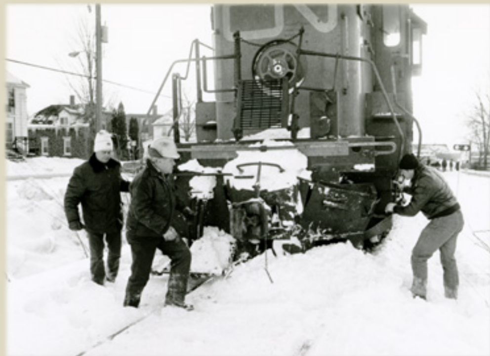
Fonds Les Voies de l'Est, photo de Alain Lévesque, 1986, Société d'histoire de la Haute-Yamaska.

Le 4 janvier 1986, un train de marchandises entre en collision avec une fourgonnette à l'angle des rues Saint-Charles et Dorchester. Trois autres accidents de même nature avaient eu lieu à Granby l'année précédente.