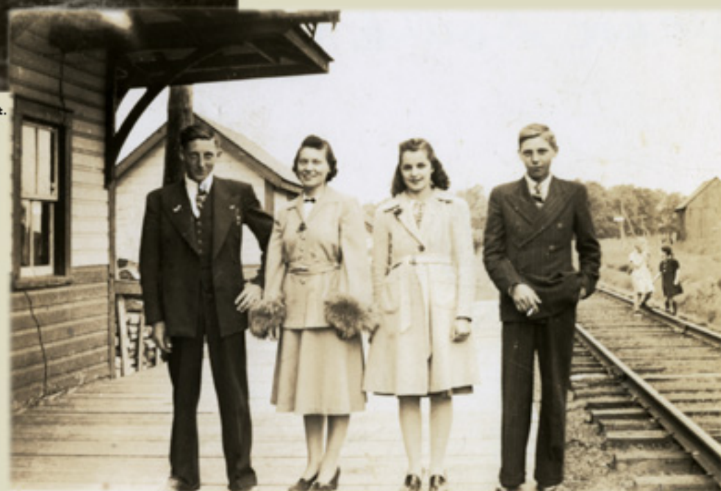
Johanne Rochon © Société d'histoire de la Haute-Yamaska, 2011

Des résidents du hameau de Roxton-Sud (South Roxton) sur le quai de la gare, vers 1950.