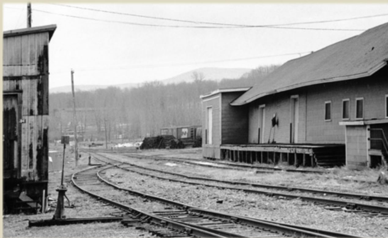
Fonds La Voie de l'Est, photo Alain Dion, 1987, Société d'histoire de la Haute-Yamaska.

En 1990, le Canadien National abandonne toutes ses activités ferroviaires à Granby, alléguant leur non rentabilité.